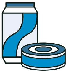
Latas de Aluminio y Hojalata