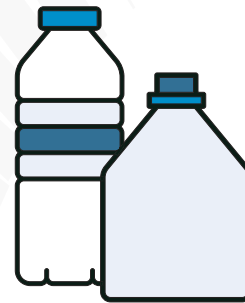
Botellas de Plástico

*Utilice bolsas de plástico transparentes cuando recicla sus materiales.